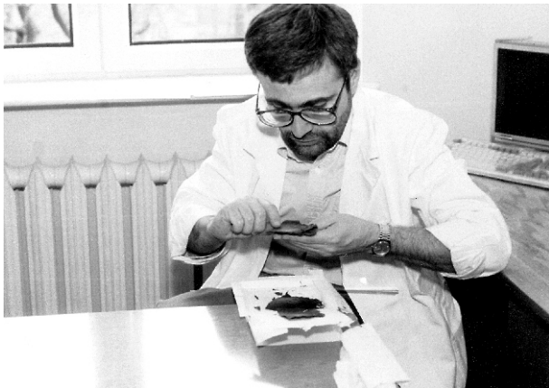
Fig. 4. As an expert in the Section for Questioned Documents Examinations.

sented in full – even exceeding expectations. He transformed the Institute of Forensic Research into an institute that was thoroughly modern, and sometimes even pioneering and innovative, realising its expert and research aims in a way that was concordant with world standards, and also determining directions of development of forensic sciences not only in Poland but also in the world.