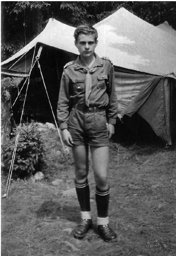
Fig. 2. On a scout camp in 1970.