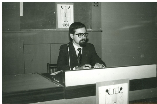
Fig. 3. During a meeting of the the Jagiellonian University Law Students’ Library Association.