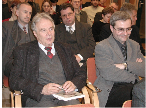
Fig. 6. With Professor Stanisław Waltoś during a promotion of a book published by IFR Publishers.

ganised many seminars and one-day meetings in Kraków, devoted to more detailed specialist problems. Today, the Institute of Forensic Research has its representatives in each of a dozen or so working groups functioning within the framework of ENFSI.