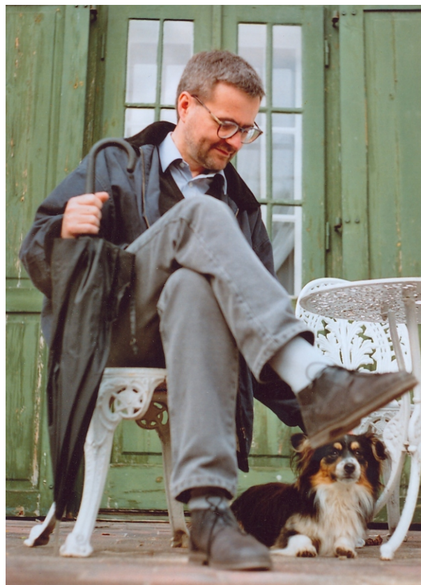
Fig. 7. On holiday in Janowiec, 1998.